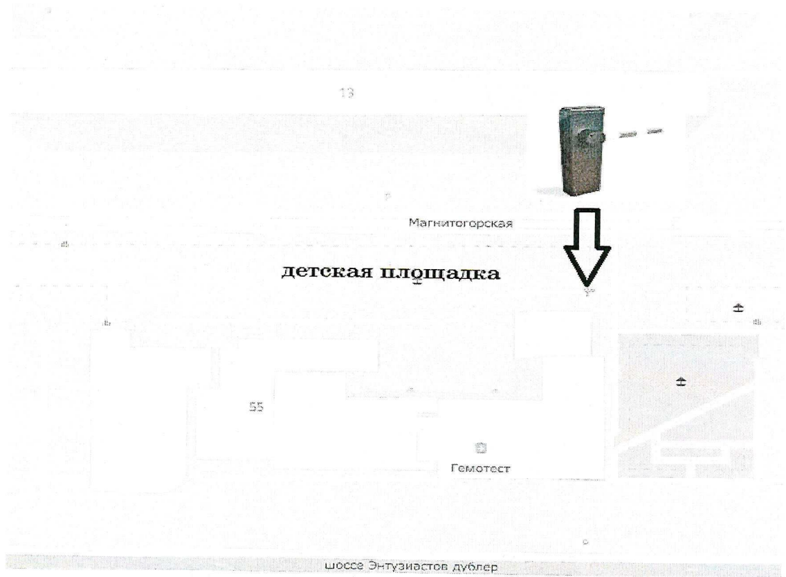
Схема размещения ограждающего устройства